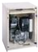
Armario insonorizado pequeño