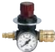
Reductor de presión