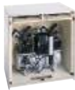
Armario insonorizado grande